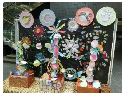
昨年の出展の様子