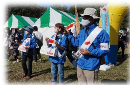
社会貢献・ボランティア活動