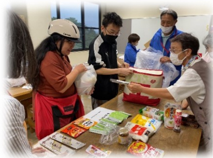
助け合い・支えあい活動