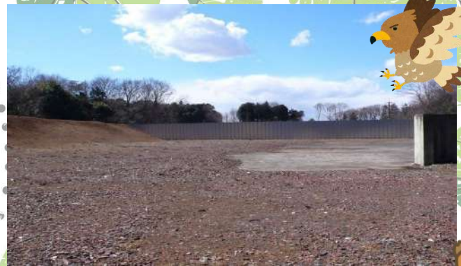
購入した時の状況（2008）

所沢市北岩岡の一角に「森の再生地」と名付けた土地があります。元々閉鎖された焼却炉の土地を「おおたかの森トラスト」が募金活動で集めた資金で購入し、「子どもエコクラブ」の幼稚園児や小中学生、地域の人々の協力で、土をかぶせ、コナラやクヌギを植樹し、水辺のビオトープを作るなど、在来種の植栽管理によってもとの雑木林にもどす「自然再生」を進めています。