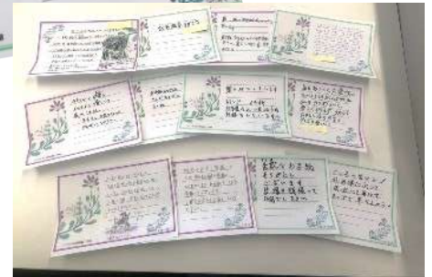
夏ボラメニュー「メッセージカードづくり」で作成したカードを 有料老人ホーム翔裕館の利用者様にお渡ししている様子