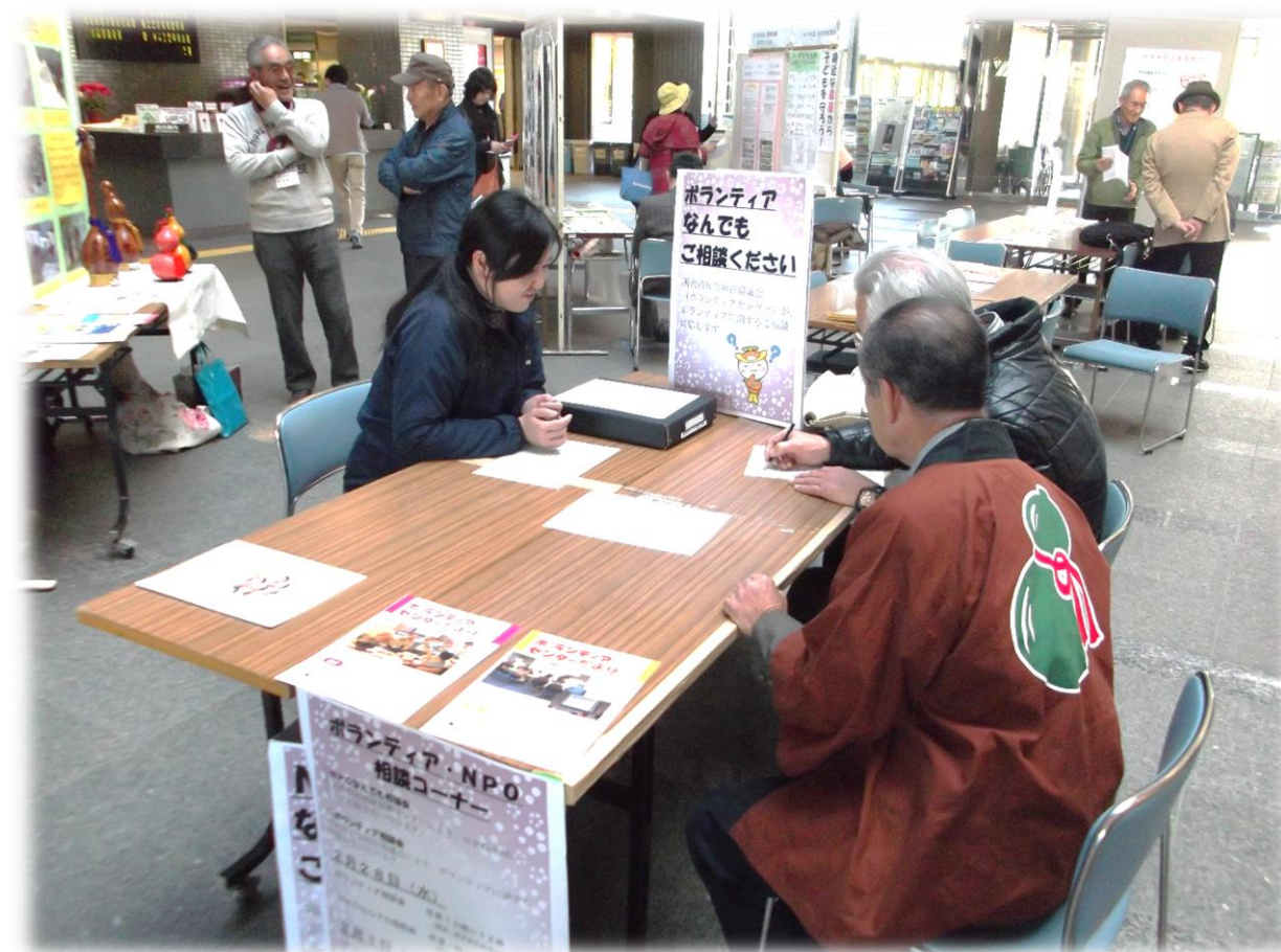
今号の PICK UP ... 所沢市民活動見本市（2/28~3/2） ボランティア相談コーナー