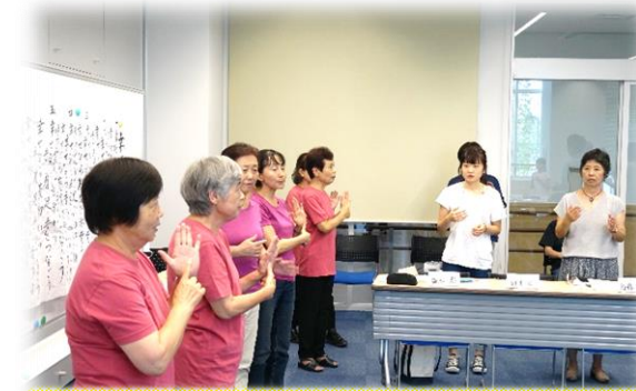
昨夏のボランティア体験プログラム 上: 手話体験 下: 報告・交流会

いくつかあるボランティア体験メニューからご自身の興味のある分野での体験を行います。ボランティアの心構えや参加者同士の交流会もあります。