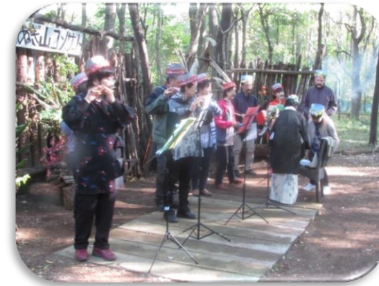
↑ くぬぎ山コンサート “しの笛”の音が響き渡りました。

中には、簡易ステージと広場があり、11月には紅葉とリンドウを愛でながらの「くぬぎ山コンサート」を開催しています。元々は野外でコンサートをしたいという演奏家の声から2009年にスタートしたコンサートも、毎回70～100名が来場しています。また、アカペラコンサートやクリスマス会で使われたり、近くの保育園児たちがどんぐり拾いに来たりと、思い思いに自由に過ごせる場になっています。