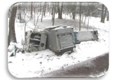
↑ いろんな物まで、捨つられてるんですよ。