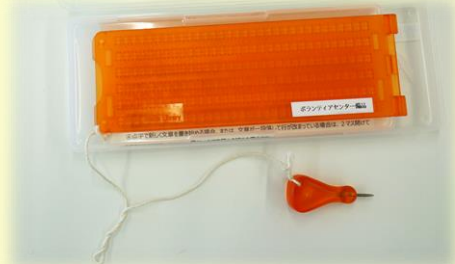
小型点字器 120個 (点字体験で使います)

授業に必要な車イスや白杖等の機材を貸し出しています。また学習用DVDや書籍なども貸し出しています。期間は7日間となります。