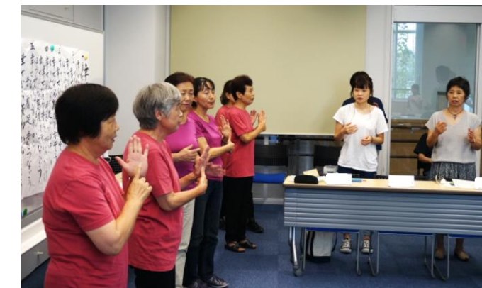
手話サークル二三（ひふみ）