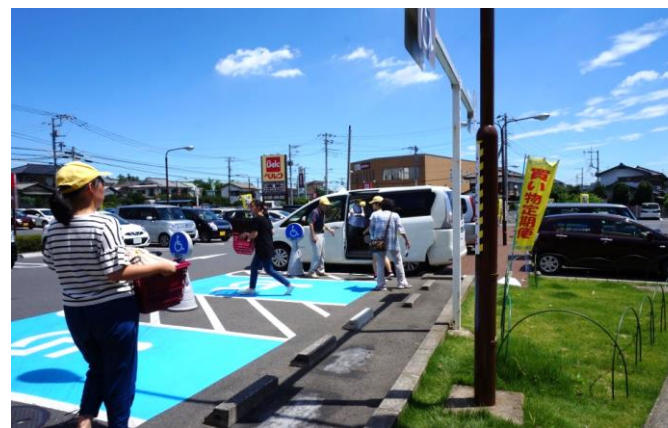
椿峰まちづくり協議会 買い物定期便部会