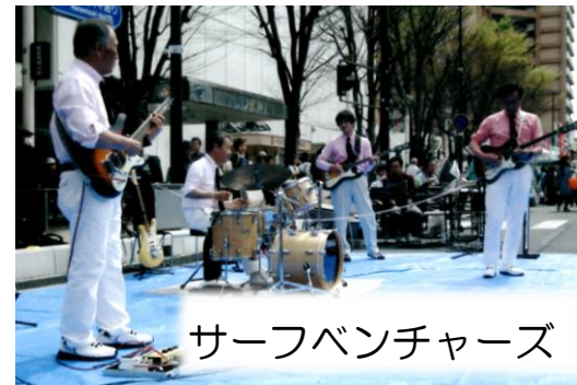
サーフベンチャーズ

今号の PICK UP ... 「演芸ボランティアガイド」にご登録されている皆さん