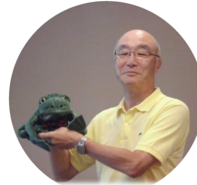
楽しいハゲマロ腹話術