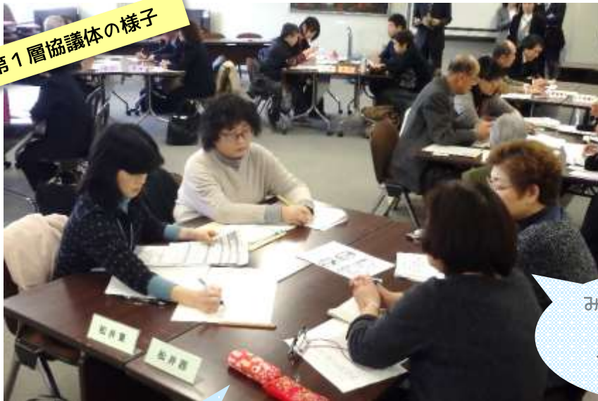
第1層協議体の様子