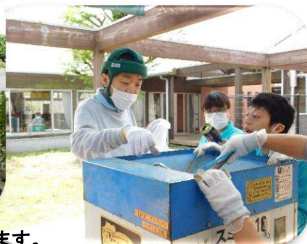
大量の缶を機械でどんどんつぶします。