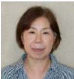
うちの 内野 事務員

はじめまして。3月に大学を卒業して4月からマリングループに配属になりました。好きなことはお菓子作りと甘い物を食べることです！皆さんの好きなこともぜひ教えてください。これからよろしくお願いします。