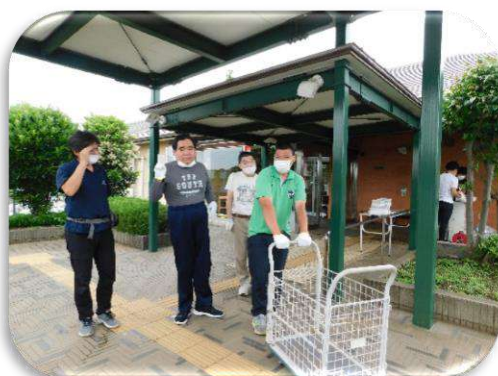
地域をまわって缶を回収します。

<空き缶の回収>プロペラ周でご協力いただいている方々からアルミ缶を回収しています。毎週火曜日の午前中、分担して回収に行きます。ご家族からもいただくことがあります。