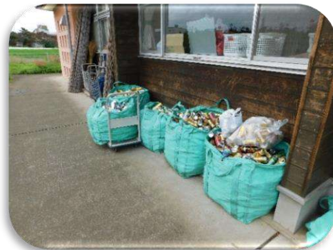
集めた缶は一度保管します。

<機械で缶をつぶす>缶つぶし機「カバちゃん」でどんどん空き缶をつぶします。瓶や鉄缶は取り除きます。