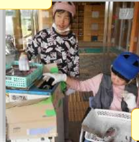
作業や仕事もバリバリやっています