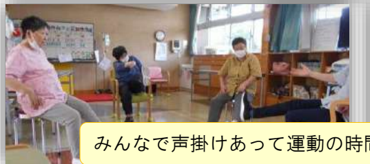
みんなで声掛けあって運動の時間もしっかり頑張っています