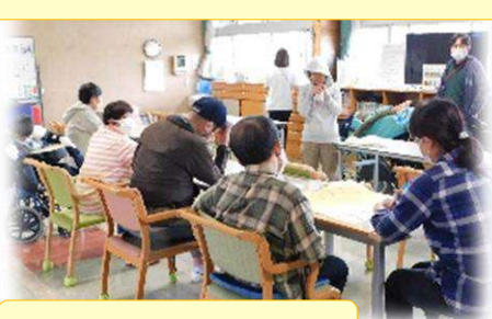
仲良くやっています