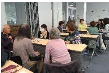
援助会員グループワーク