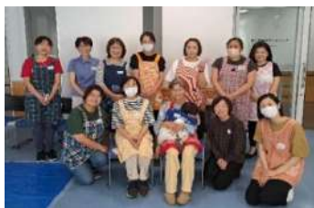
親子ヨガでのお子さんの見守り