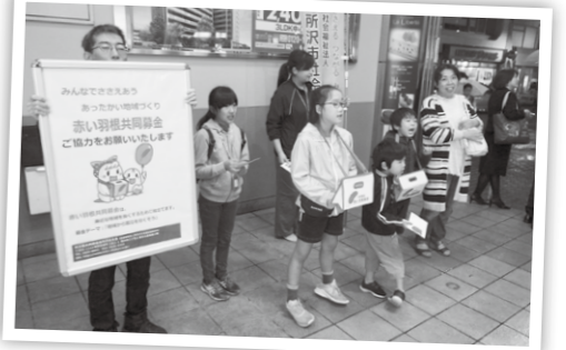
「赤い羽根共同募金」街頭募金の様子