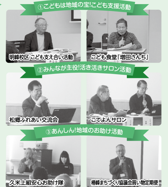
【平成30年3月3日(土) 所沢市子どもと福祉の未来館にて開催】