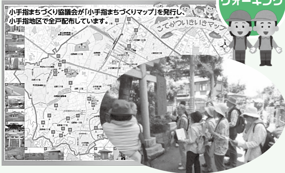
小手指まちづくり協議会が「小手指まちづくりマップ」を発行し、小手指地区で全戸配布しています。

ボランティアグループの『こてかつ』は、平成22年度に「知ろう!つながろう!わがまち小手指」をスローガンに、誕生しました。はじめはマップ作りからスタートし、実際にまちを歩いて取材をしてみると、小手指地区には史跡や石碑などがたくさんありました。身近なところに歴史や文化に触れられる場所があることに気がついて、今度はこれを住民にも知ってもらおう活動へとつながりました。今ではマップを活用したウォーキングイベントにまで発展しています。