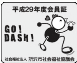
※参考見本 平成29年度会員証デザイン