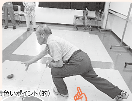
黄色いポイント(的)