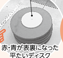
赤・青が表裏になった平たいディスク