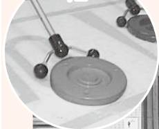
ディスクとキュー

シャフルボードはもともと船旅の間に甲板で過ごす際のレクリエーションとして広まったスポーツです。平たい円盤(ディスク)を棒(キュー)で押して、得点エリアの枠内へ滑らせ、最終的に4枚のディスクの合計点を競うゲームです。ディスクの裏にはローラーがついていて、キューも軽いので、腕力が少ないお子さんや高齢者の方、車いすを利用されている方でも参加できて楽しめます。