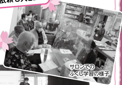
サロンでの ふくし学習の様子