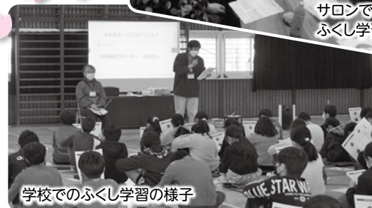
学校でのふくし学習の様子