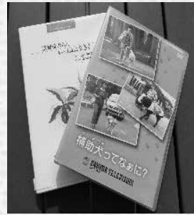
福祉に関するDVDや書籍