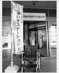
車いすちよい借りステーション