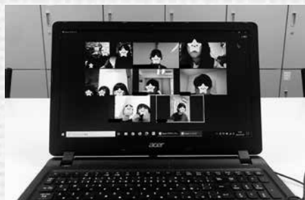
Zoomを活用した居場所の様子

コロナ禍により、これまで居場所を通じて一緒に遊んできた友達や地域のボランティアが、なかなか会うことが難しくなりました。そこで、Zoomを活用することで、つながりを絶やさず、継続した活動ができるようになっています。