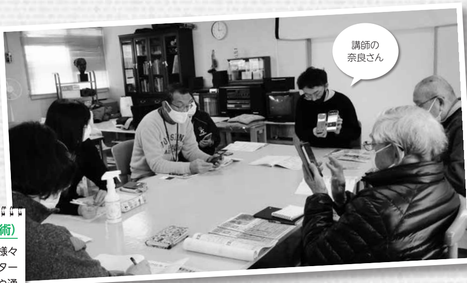
HU-MUS (ヒューマス) 株式会社によるスマホ教室の様子

コロナ禍の新しい生活様式として、地域でも高齢者向けのスマホ教室が広がっています。