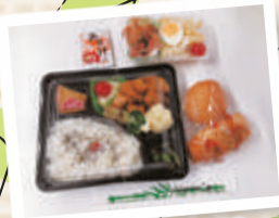
▲フードパントリー のお弁当の一例