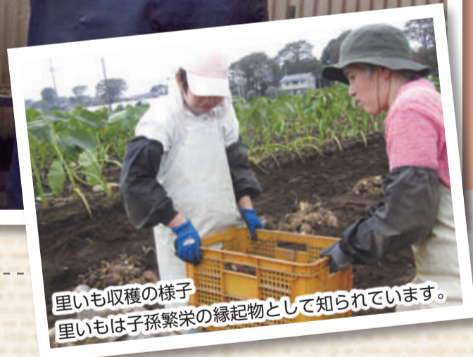
里いも収穫の様子