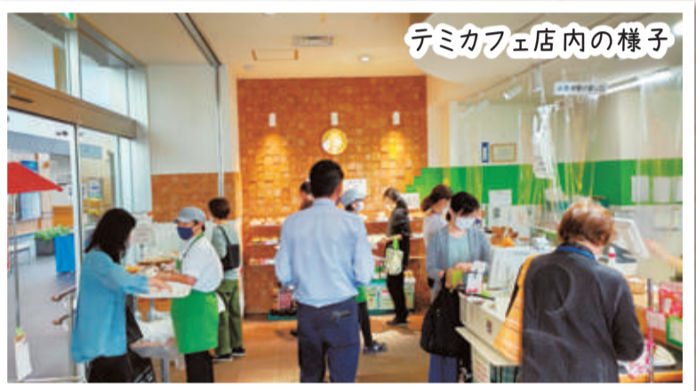
テミカフェ店内の様子

「所沢市こどもと福祉の未来館」1階にある事業所です。「どんなことも まずはやってみる」がお店のモットーです。(このやってみるがテミカフェの由来です。) 従業員みなさんも元気で明るく、とても利用しやすいお店です。障がいのある方も自分の作業分担をしっかりと責任をもって取り組んでいます。