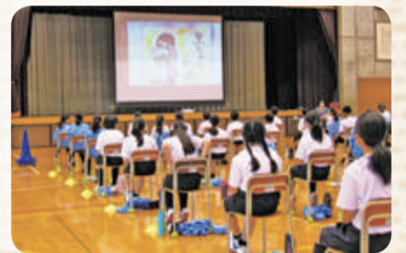
中学校でのふくし学習の様子