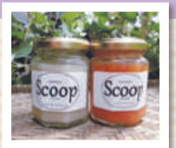
▲加工品の野菜ジャム「Scoop(スコップ)」 左:さといも 右:にんじん

今年度に入り、新しくジャムの加工品の販売も取り組み「所沢市観光情報・物産館 YOT-TOKO(よっとこ)」にて行っています。