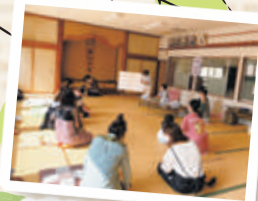
▲赤ちゃんと お母さんの集い