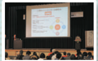
▲平成30年度開催の様子