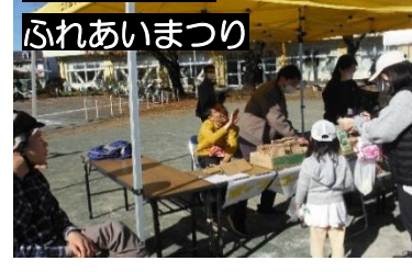
お店を回って、店番も