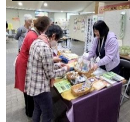
商品売りしました！