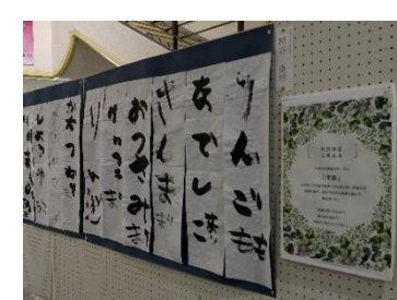
こあふる・光の園合同開催！