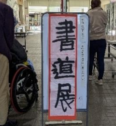
言葉に思いを込めて