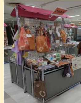
所沢市内の多くの施設が出店しました。