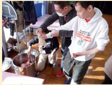
草木染め製品やビーズアクセサリーなどを作成しました。