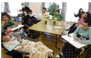
フラワーアレンジ