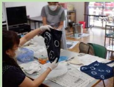
ご自分で絞り（柄のこと）を入れ、オリジナルの作品ができました。