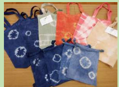
素敵な色に染まります。