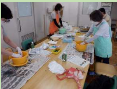
和やかな雰囲気の中で行えました。

令和5年8月5日（土）にこあふるで染め教室を開催しました。こあふるの染め教室は、定期的に催されるイベントでしたが、新型コロナウイルス感染拡大防止の関係で、4年ぶりの開催となりました。今回は「藍・玉ねぎ・コチニール」と3種類の染め液を用意し、参加した方のお好きな色でエコバッグ、巾着を染色していただきました。以前からご参加いただいている方や今回初参加のお子様まで、皆様楽しんでいただけた様子でした。これからもこあふる名物の「草木染め」に取り組んでいきたいと思えます。