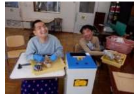
アルミ缶つぶし作業中